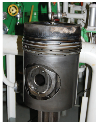
Um pistão do motor auxiliar

O efeito positivo colateral, que vem quase gratis: Com o revestimento das superfícies no motor de combustão a máquina não só funciona de forma mais suave e com menos vibrações, mas também reduz a temperatura do óleo de circulação, o que influencia positivamente a vida útil do motor e a durabilidade do lubrificante.